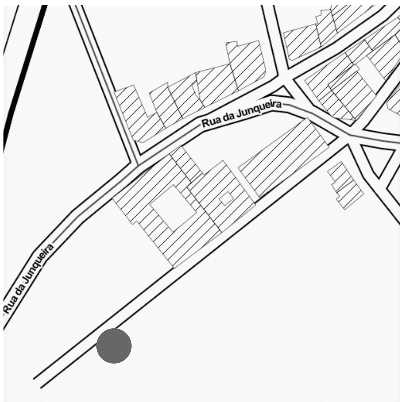
LX FACTORY—Rua Rodrigues de Faria 103, 1300-501 Lisboa