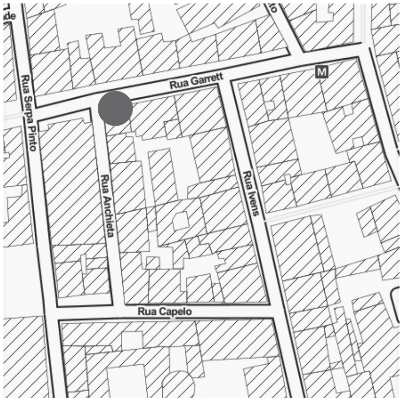
FÁBRIA FEATURES LISBOA—United Colors of Benetton 4º andar Rua Garrett, 83 Lisboa