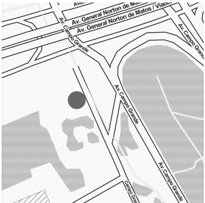
MUSEU DA CIDADE—Campo Grande 245, 1700-091 Lisboa